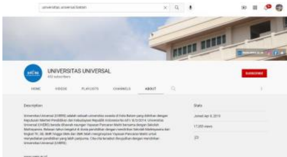
Gambar 1.1 Profile Youtube Universitas Universal