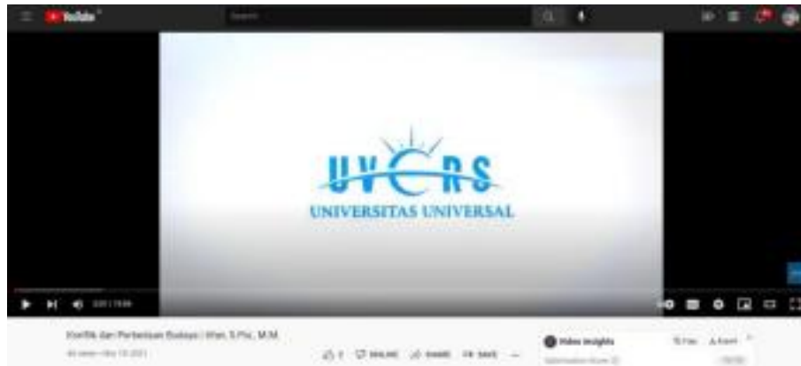
Gambar 1.3 Video Youtube dengan viewers sedikit dan biasa

oleh dosen tersebut, antara lain terdapat playlist yang berjudul “Yuk Belajar Manajemen, Yuk Belajar Teknik Lingkungan, Yuk Belajar Seni Tari, Pandai berbahasa mandarin, dan Yuk Belajar Seni Musik”. ( Playlist UVERS )